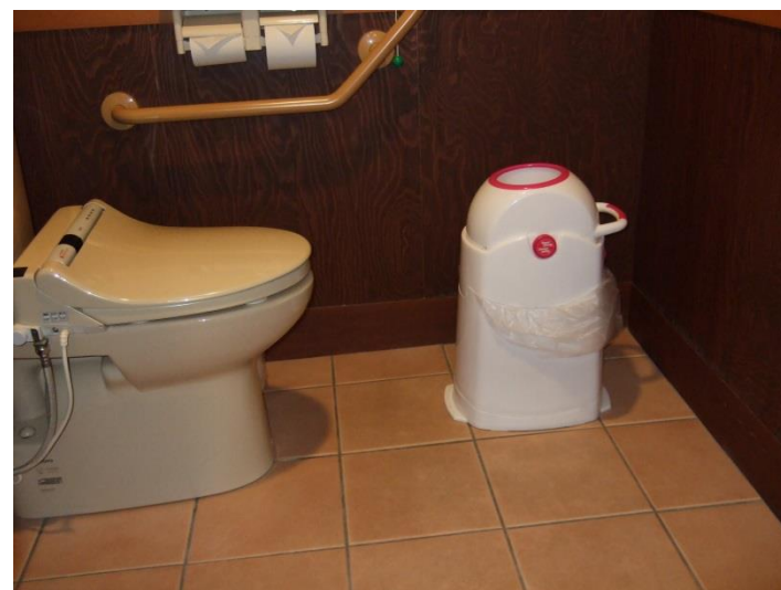
白い容器はオムツ用