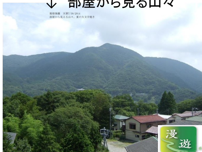
箱根強羅 天翠7/30/2014 部屋から見える山々、夏の大字焼き