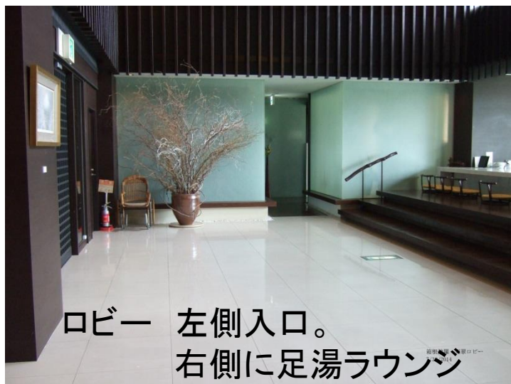
ロビー 左側入口。 右側に足湯ラウンジ