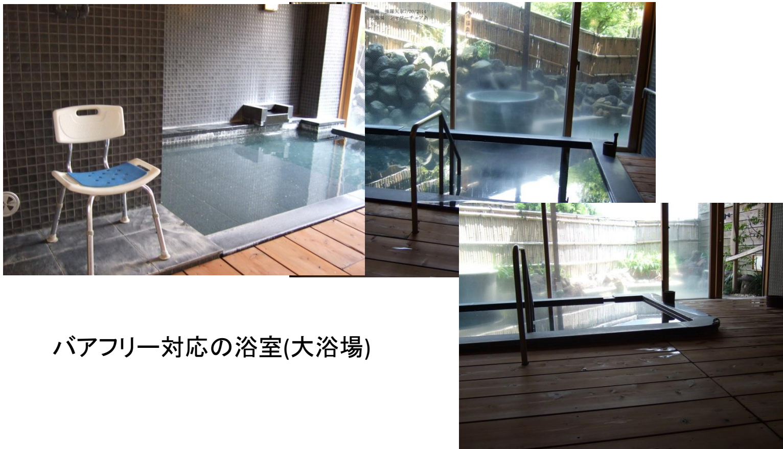
バリアフリー対応の浴室(大浴場)