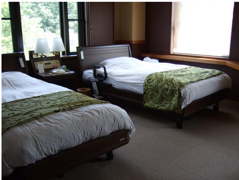
ベッドは電動で頭部、下部ジャッキ付