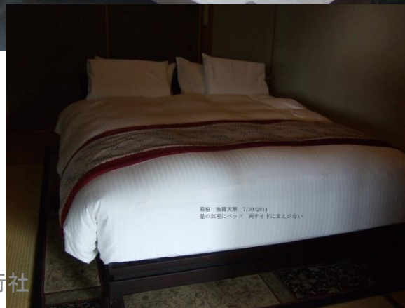
箱根 強羅天翠 7/30/2014 畳の部屋にベッド。両サイドに大きな引き出しあり